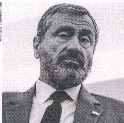
Torquato (à esq.) deixará o Ministério da Transparência e substituirá Serraglio que, por sua vez, assumirá a pasta da Transparência

Após a escolha de Torquato para a Justiça, o Planalto se divi-